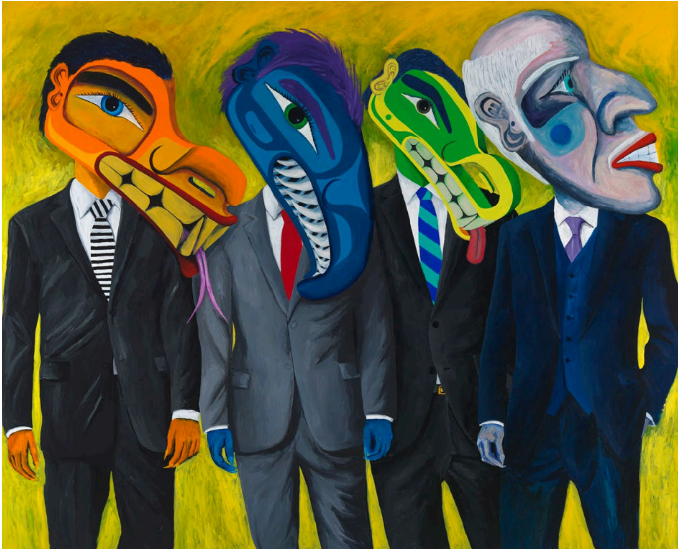
《百分之一》劳伦斯·保罗·尤克斯伯顿（加拿大）作于2015年

以下六大要点涵盖了美国主导的世界秩序自1990年形成直至当今因俄罗斯和中国崛起而受到削弱的过程，有助于我们理解当今世界局势。这些要点是从2021年1月第36期汇编《日暮之光：美国操控力的削弱以及多极化的未来》（ Twilight: The Erosion of US Control and the Multipolar Future ）中得出的，旨在交流讨论，欢迎反馈。