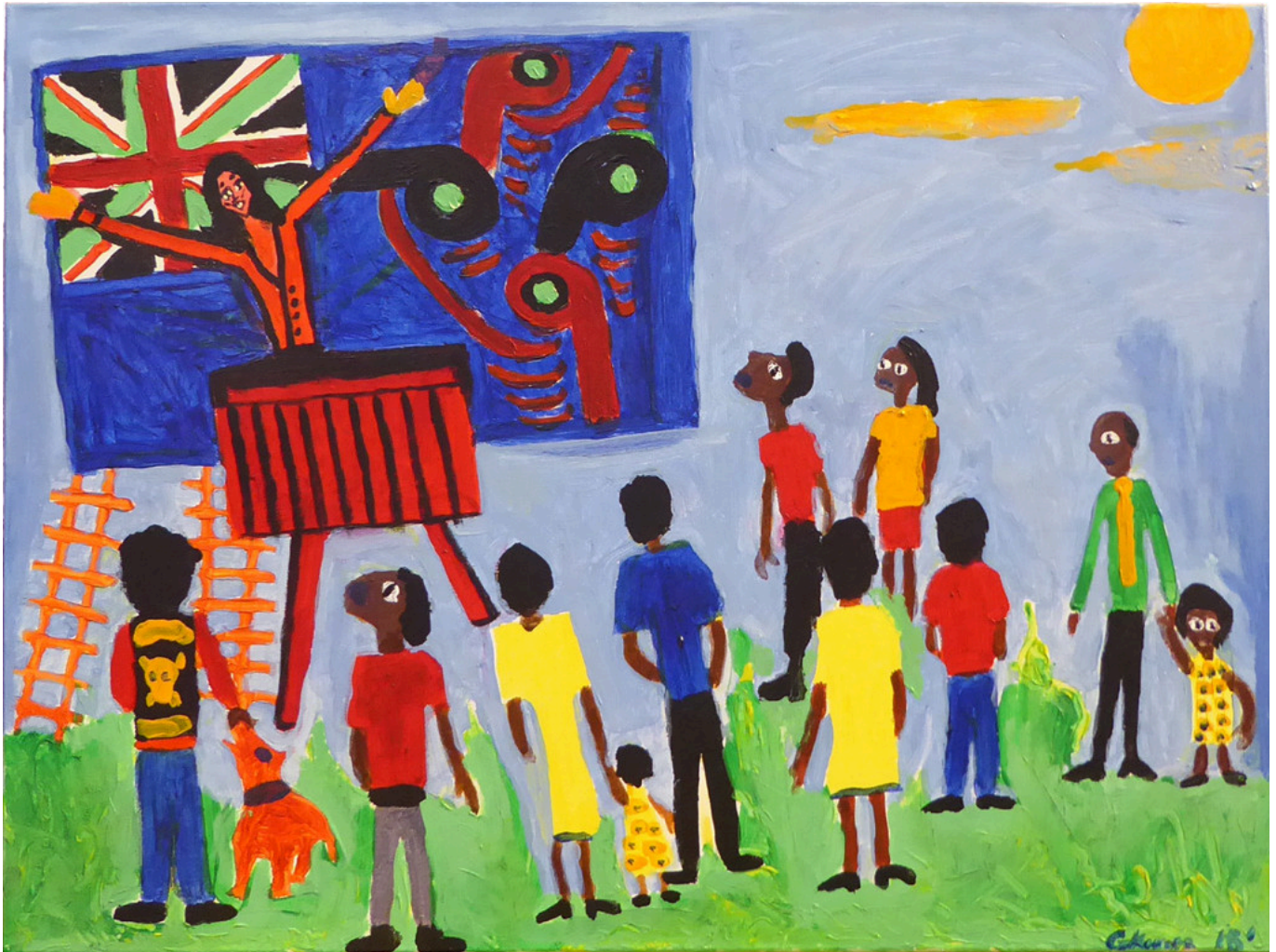
《杰辛达的计划》乔治·帕拉塔·基瓦拉（恩加蒂-波罗乌部族和特艾唐阿-阿马哈基部族[新西兰]） 作于2021年

中国对东亚和南太平洋的其他国家构成威胁，而在于中国正在阻止美国在该地区和周边水域发挥主导作用——包括中国领海范围外的水域，美国在那里与其盟国举行了“航行自由”联合军演。肯德尔继续道：“我并不是说太平洋地区的战争迫在眉睫或不可避免。事实并非如此。但我要说的是，这种可能性正在增加，并将继续增加。”