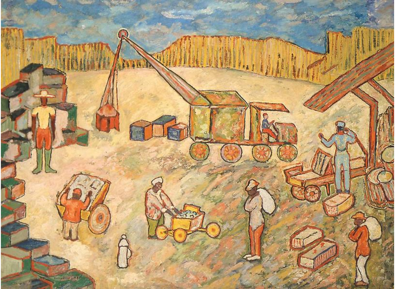
《交换场所》 柏福德·德莱尼（美国）作于1943年

拒绝新冷战 平台与三大洲社会研究所联手对这项议题提出了极为重要的质疑。下面刊登题为《美国搞乱了世界经济》（ The United States Has Destabilised the World Economy ）的 第2期简报 ，该文证明，当前通胀危机的关键原因在于美国对全球经济的过度影响，包括美国军费开支、美国在全球消费中所占比重、华尔街-美元-国际货币基金组织体系的影响等因素都起到了关键作用。希望读者认可本期简报的内容，并广为传播。