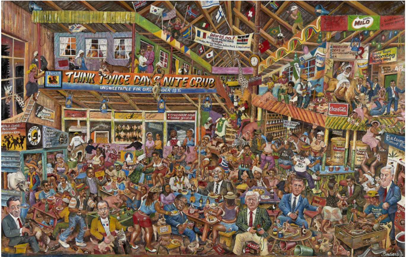
《酒吧》约瑟夫·贝尔蒂耶斯（肯尼亚）作于2020年

针对“全球通胀源自俄乌战争和西方对俄制裁”的粗浅观点，第2期简报指出了这场危机的根源：美国军事开支和华尔街-美元-国际货币基金组织体系控制世界经济所造成的各种扭曲。