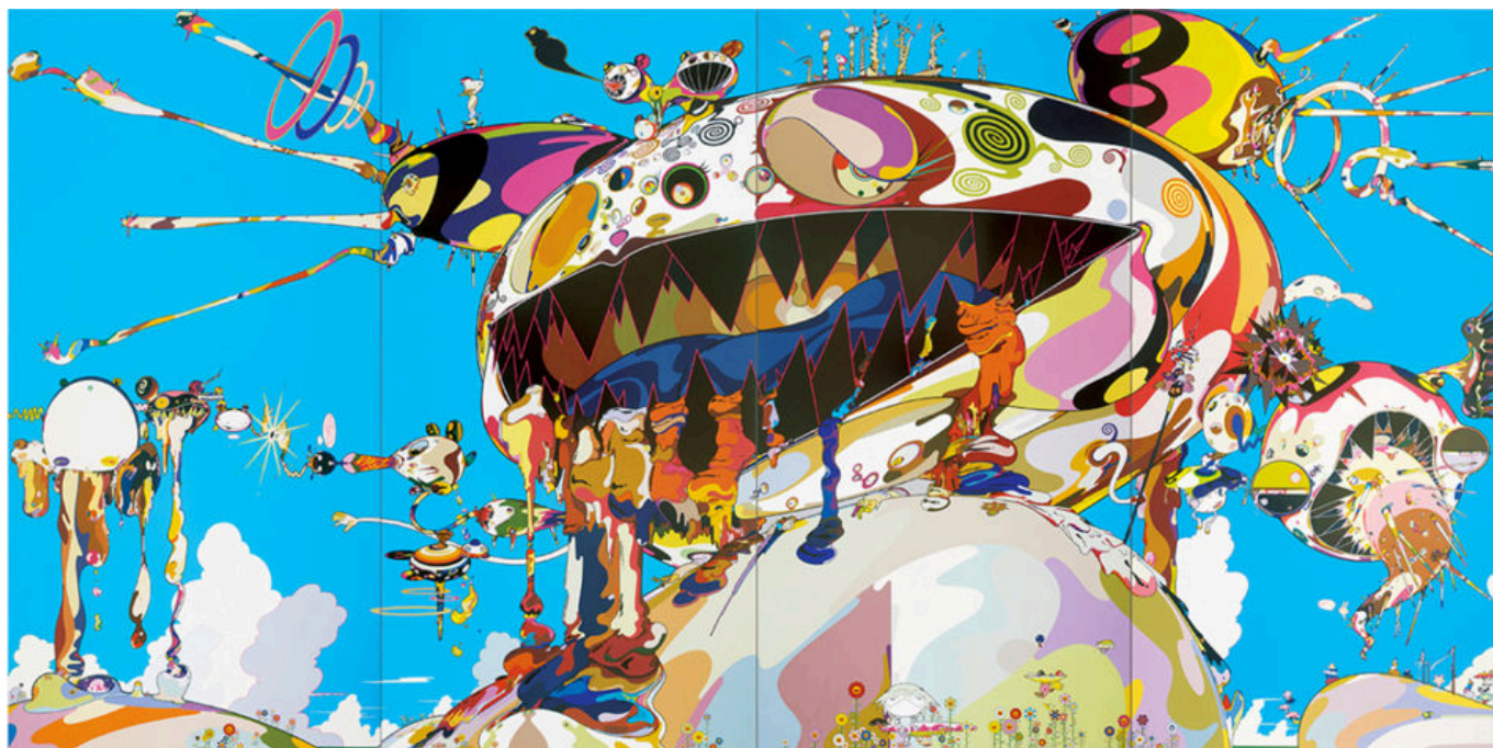
《吃自己腿的章鱼》 村上隆（日本）作于2002年