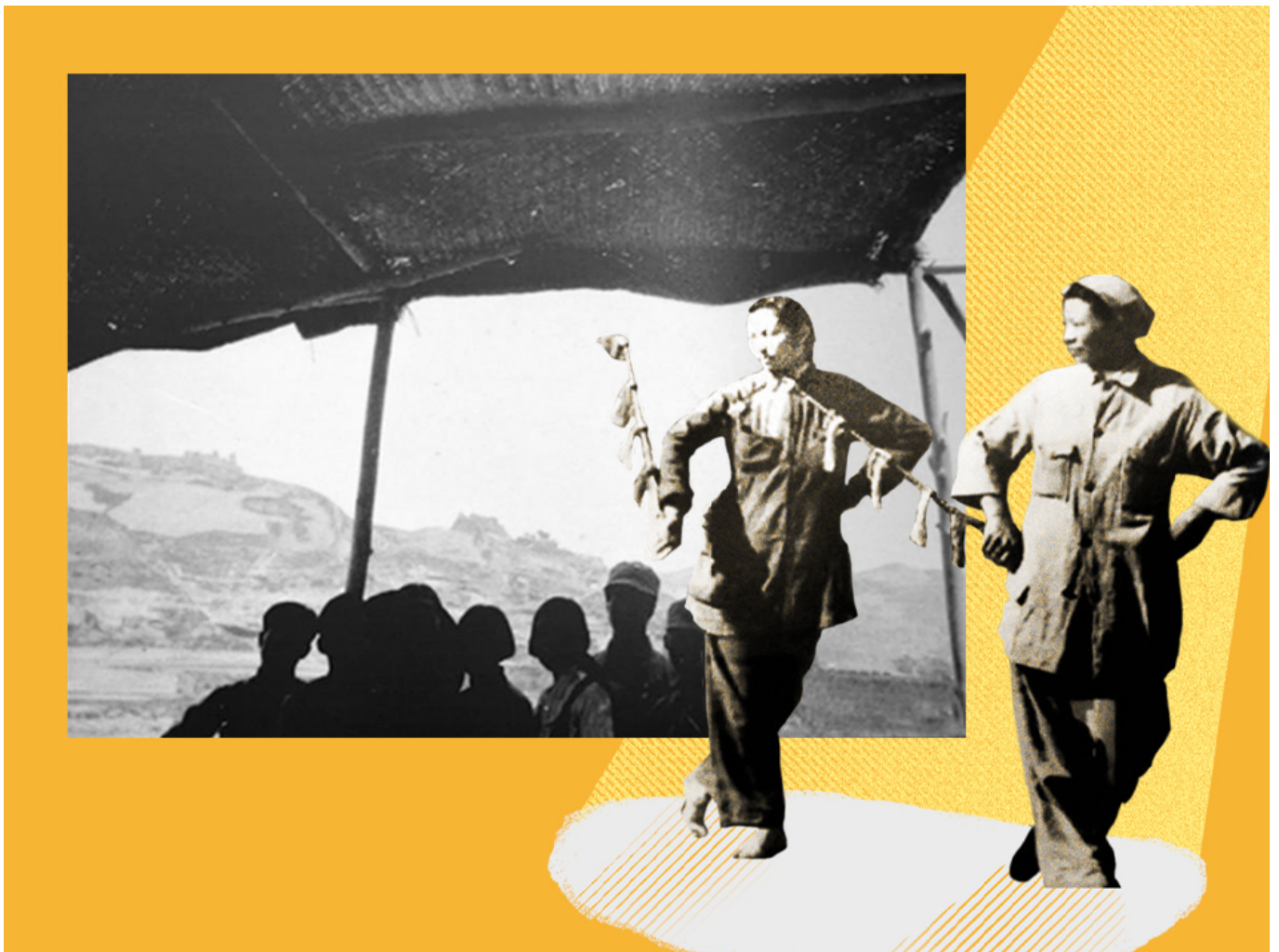
前图：京剧团演员在练功。后图：鲁迅艺术学院戏剧系学生在自建的席棚排练戏剧

阿布·阿克利赫遇害时报道的袭击发生在杰宁，巴勒斯坦著名的 自由剧院 便位于此。2011年4月4日，剧院创始人朱利亚诺·梅尔·哈米斯在离阿布·阿克利赫遇害地不远处遭到枪杀。梅尔·哈米斯 曾说 ：“以色列正在摧毁巴勒斯坦社会的神经系统。这个神经系统包括文化、身份、交流……我们必须振作起来。我们正在卑躬屈膝地生活。”