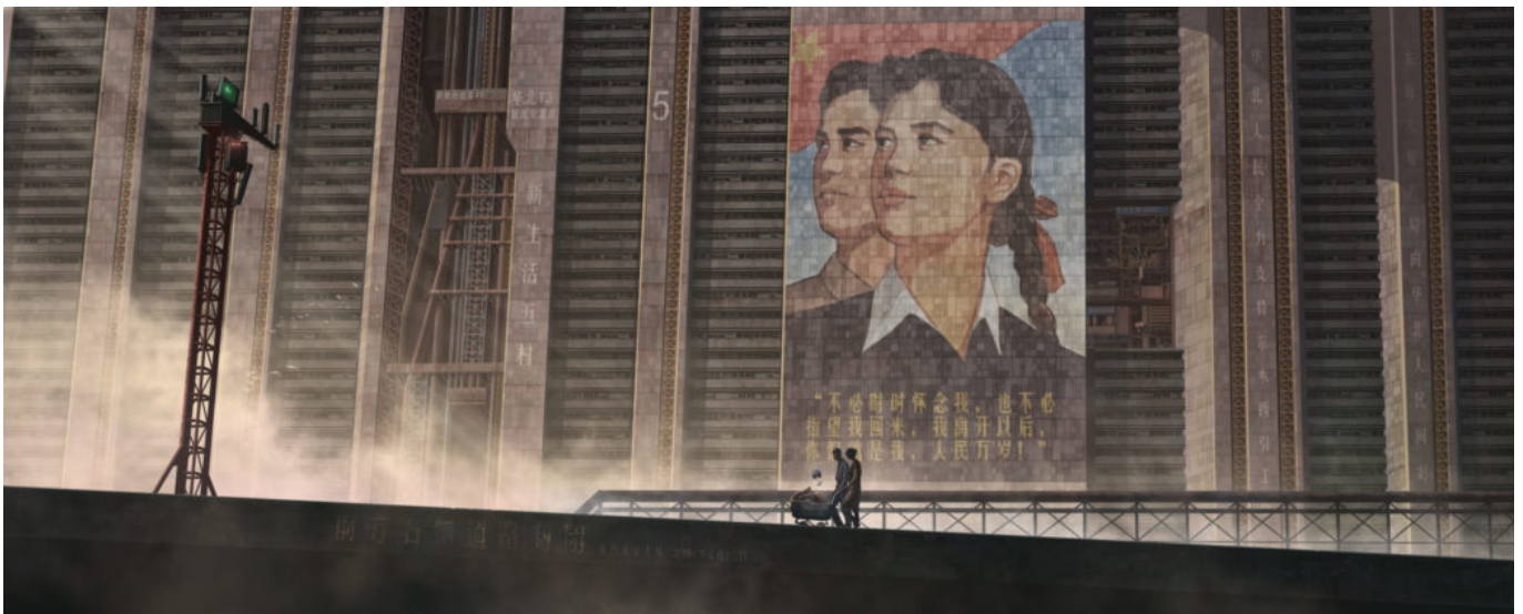
《中国2098：太阳照常升起》范文南（中国）作于2019—2022年