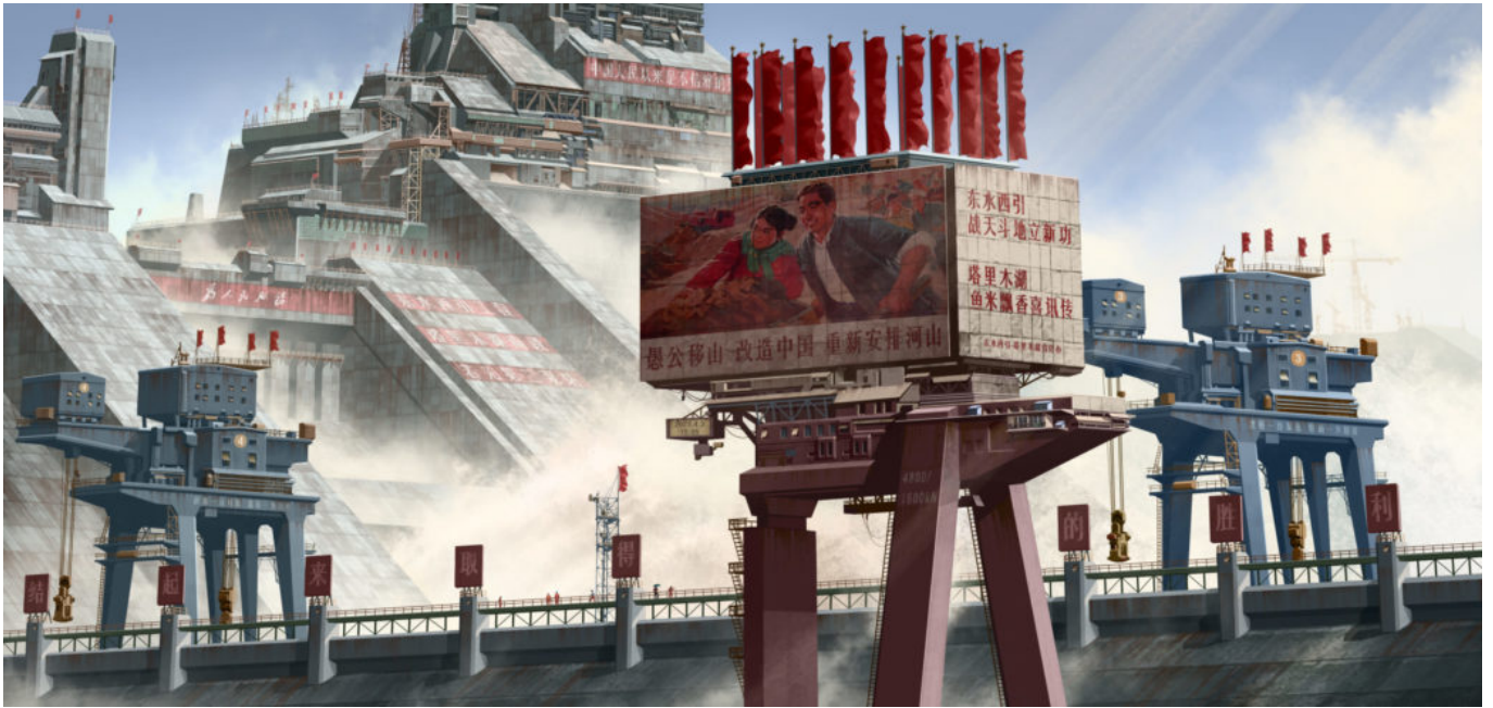
《中国2098：塔里木湖南段——若羌泵站》范文南（中国）作于2019—2022年

《文化纵横》国际版第二期文章的一个重要观点是，社会主义原则以及使其成为可能的社会主义基础架构，尤其是中国共产党，对于消除极端贫困至关重要。除非其他国家也将其计划建立在社会主义基础之上，否则中国的社会主义现代化道路难以成为其效仿的模式。消除贫困不能仅靠现金转移计划或农村医疗计划，尽管这些政策选择具有重要价值：消除贫困靠的是把尊严等理念变成现实的社会主义承诺。