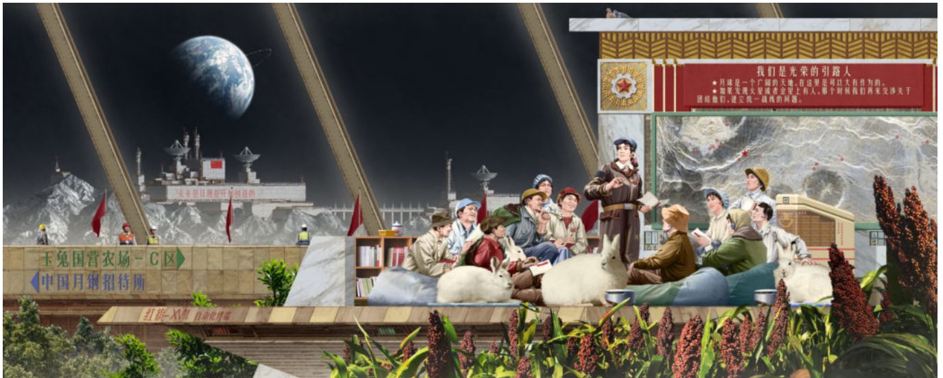
《嫦娥同志》范文南（中国）作于2022年

2017年，世界银行认定每天收入1.9美元的贫困线过低，将贫困线上调为每天2.15美元，覆盖超过7亿人口。世界银行发布的《2022年贫困与共享繁荣》（2022 Poverty and Shared Prosperity ）报告显示，根据2019年的数据，如果将贫困线设定为每天3.65美元，全世界将有23%的人生活在贫困中；如果贫困线为每天6.85美元，那么全世界近一半人口（47%）生活在贫困线以下。这些数字令人震惊。