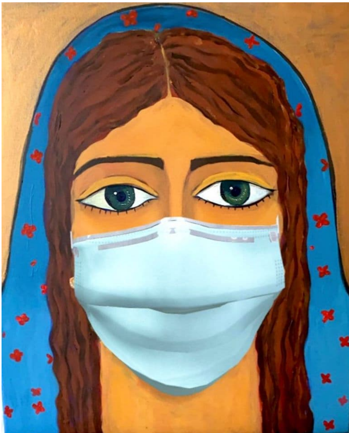
马拉克·马塔，新冠病毒前的围攻加沙，2020

尽管资金不足，世界卫生组织一直在努力遏制病毒传播。如果您能够捐款，请捐给世卫组织的 团结响