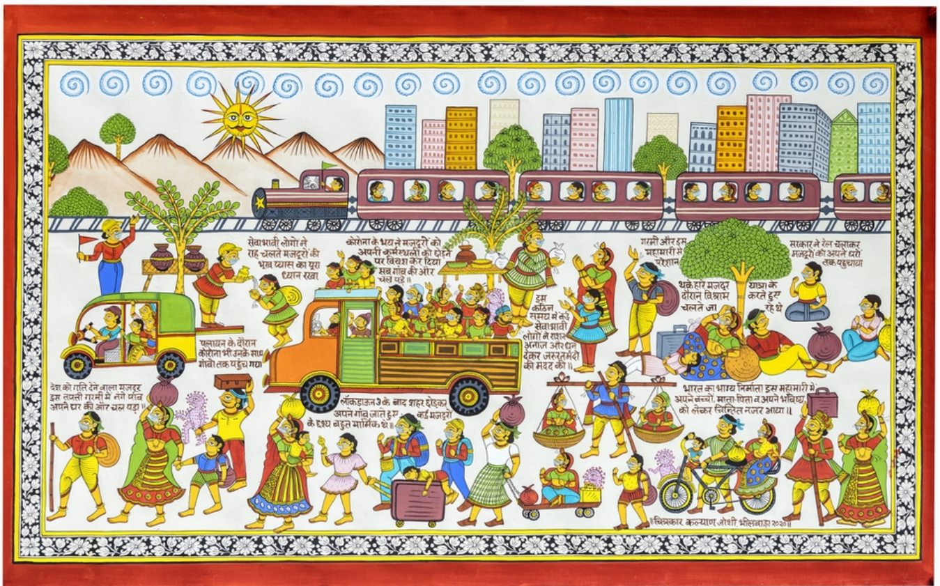
《新冠疫情时代的移民》卡利安·乔希（印度）作于2020年

对南非大选结果的冷静评估表明，从非国大分裂出来的两股政治力量——雅各布·祖马建立的“民族之矛”（uMkhonto we Sizwe, 简称MK）和朱利叶斯·马莱马创立的经济自由斗士党（Economic Freedom Fighters）——总共赢得了64.28%的选票，超过了执政联盟在1994年获得的选票。这三股势力的总体承诺（消除贫困、征用土地、银行和矿山国有化、扩大社会福利）保持不变，但各自倾向的战略却大相径庭，而他们之间的个人竞争则进一步加深了这一分歧。最终，南非将组建一个广泛的联合政府，但它是否能像墨西哥那样确定社会民主政治还不得而知。民众对制度的信心整体下降，这表明民众对任何政治方案都缺乏信心。承诺如果得不到兑现，就会变味。