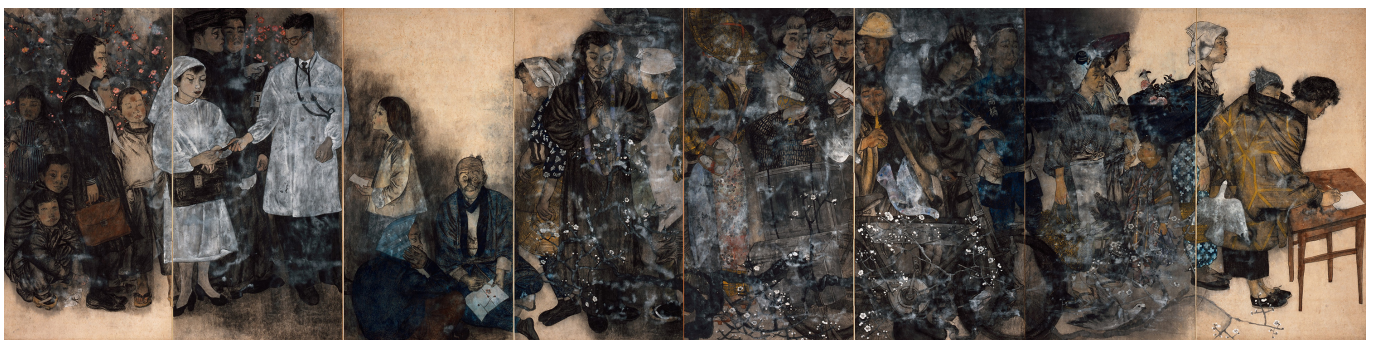
《原爆图之十：签名》丸木位里、丸木俊作于1955年

汇编的最后一部分“东北亚和平之路”介绍日本冲绳、朝鲜半岛和中国的人民运动希望找到一条和平之路。这条道路有五项简单原则：终结危险结盟、终结美国在该地区主导的战争游戏、终结美国对该地区的干预、支持该地区各斗争之间相互团结、结束亚洲军事化。例如，生活在冲绳嘉手纳空军基地和边野古湾以及韩国萨德反导系统和济州海军基地附近的人们正在多条战线上为结束亚洲军事化而斗争。