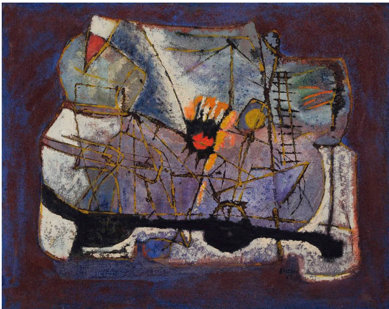
《无题》阿里夫·拉耶斯（黎巴嫩）作于1963年

以色列不仅开始轰炸拉法，而且还急忙派坦克夺取了唯一的过境点，每天只有几辆卡车获准通过该过境点运送援助物资。以色列占领拉法边境后，完全阻止援助物资进入加沙。让巴勒斯坦人挨饿是以色列的长期 政策 ，这当然是战争罪。阻止援助进入加沙也是把各国人分成三六九等的一种做法，这种划分所定性的不仅仅是这场种族灭绝，还有1967年以来对东耶路撒冷、加沙和约旦河西岸巴勒斯坦土地的占领，以及1948年纳克巴（“大灾难”）之后以色列所主张的边界内的社会不公制度。