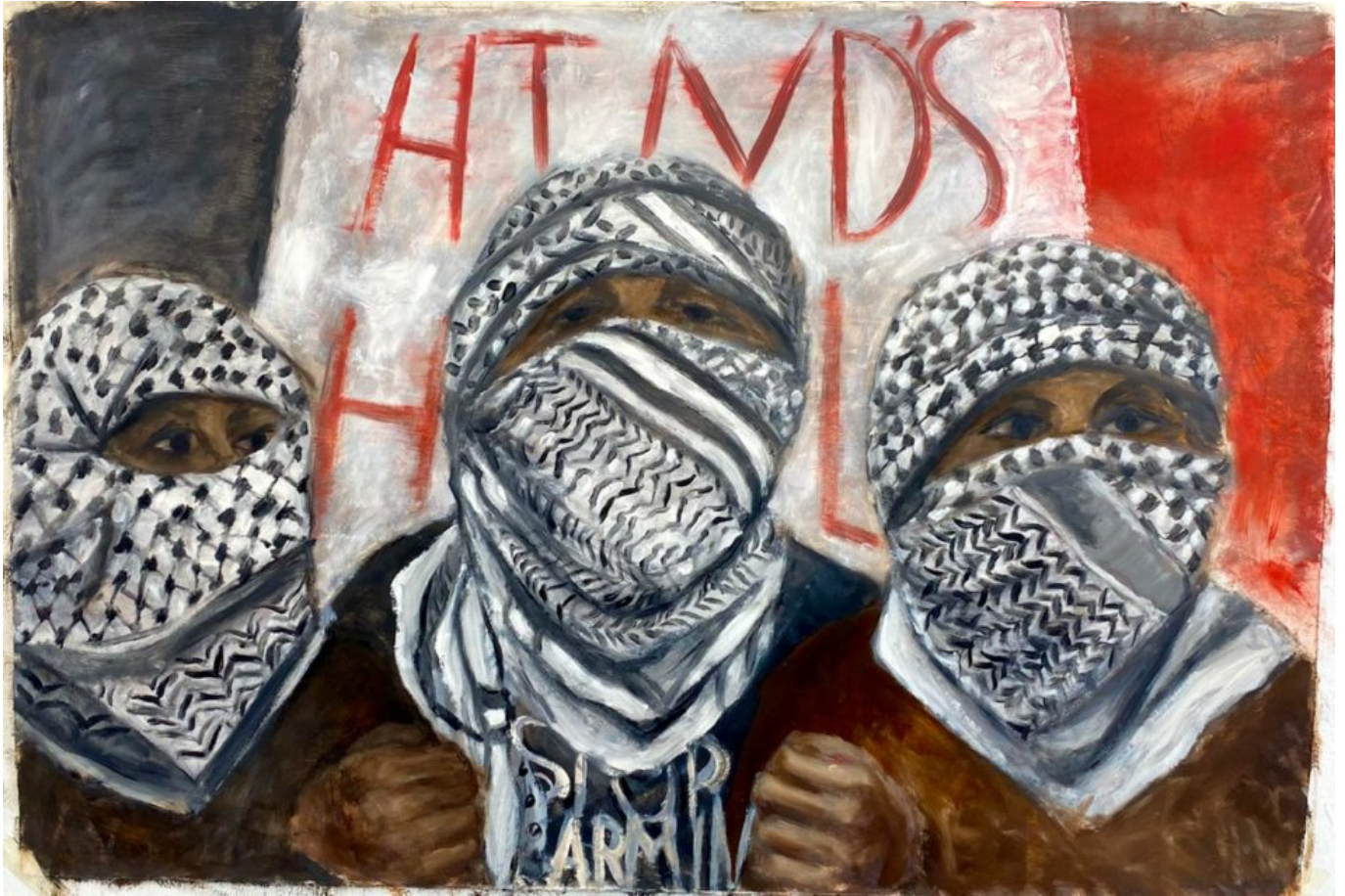
《欣德大厅》马拉克·马塔尔（巴勒斯坦）作于2024年