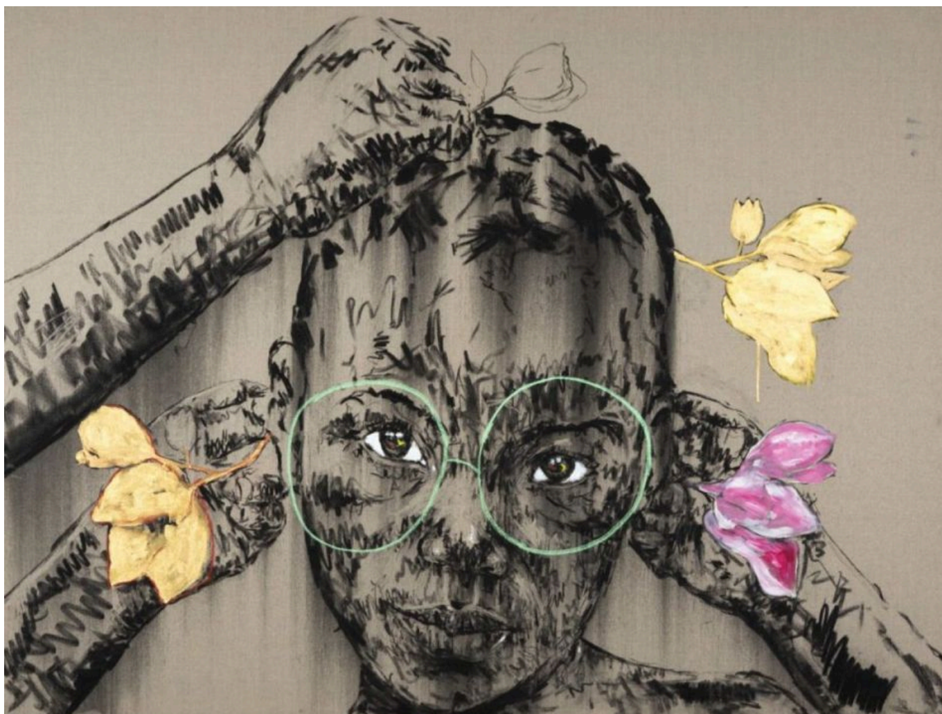
《青年的饰物》纳尔逊·马卡莫（南非）作于2019年

种族隔离 。以色列政府将 1948 年所划边界内占少数的巴勒斯坦人口（占21%）视为二等公民。以色列至少有 65 项法律 歧视 以色列国内的巴勒斯坦公民。其中一项于 2018 年 通过 ，宣布以色列为“犹太民族国家”。正如以色列哲学家奥姆里·保汉所 写 ，藉由这项新法律，以色列政府“正式认可”在以色列认定的边界内使用“种族隔离方法”。 联合国 和 人权观察组织 都表示，以色列对待巴勒斯坦人的方式属于种族隔离的定义范畴。这个词的使用完全符合事实。