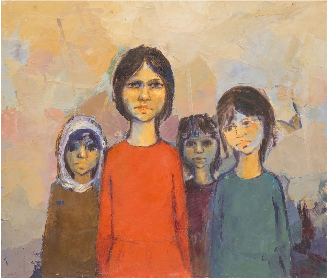
《等待》阿卜杜勒·卡德尔·赖斯（阿联酋）作于1970年前后

种族灭绝。 国际法院在 1 月 26 日发布的 命令 中认定，有“可信”（plausible）证据表明以色列对巴勒斯坦人实施了种族灭绝。3 月，联合国巴勒斯坦被占领土人权状况特别报告员弗朗西斯卡·阿尔巴内塞发表题为《种族灭绝剖析》（Anatomy of a Genocide）的重大 报告 。在这份报告中，阿尔巴内塞写道：“有合理的理由相信，表明以色列实施种族灭绝的门槛已经达到。更广泛地说，这些证据还表明，以色列的行动由其在巴勒斯坦推行定居者殖民计划所不可或缺的种族灭绝逻辑所驱动，暗示着一场被预言的悲剧。”