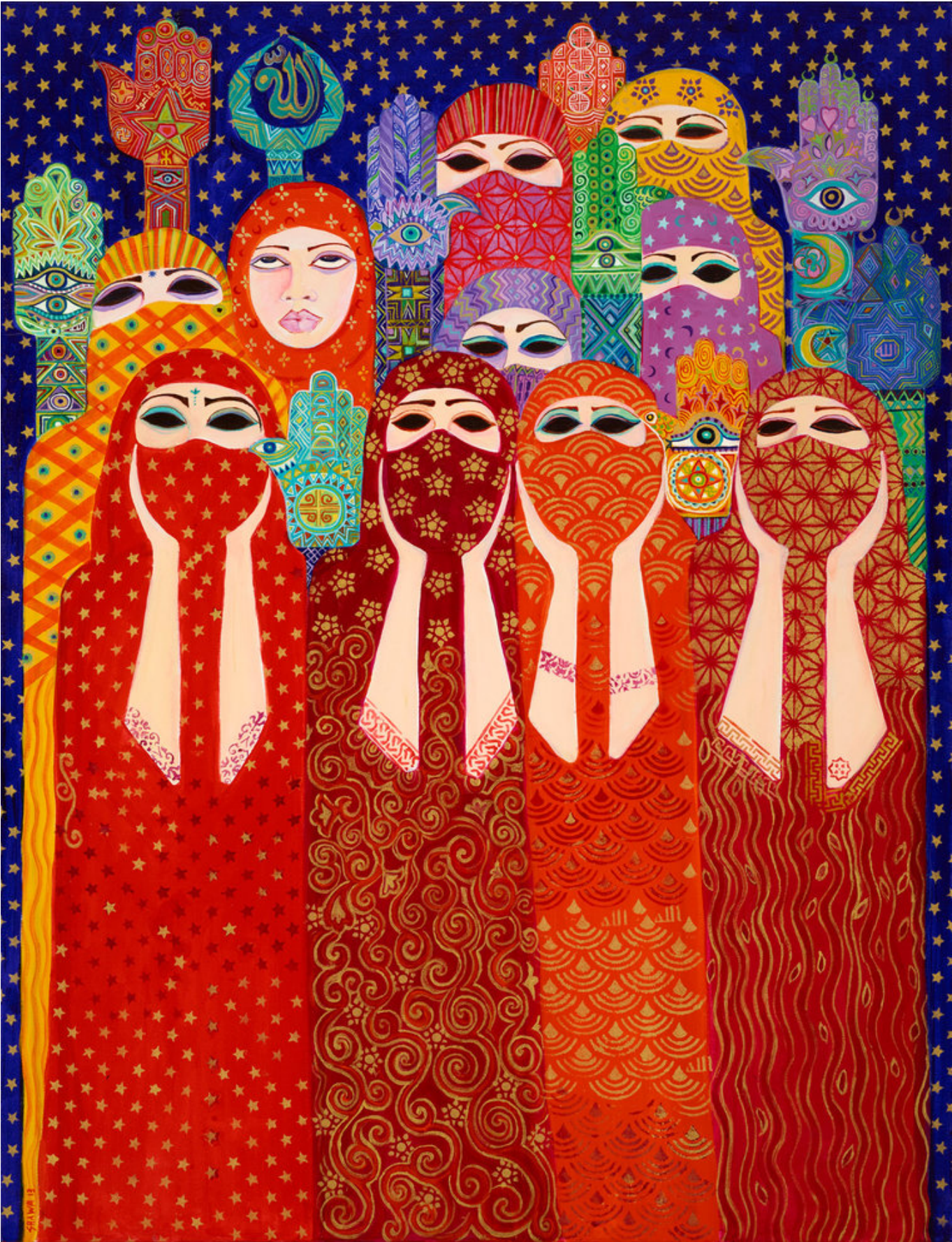
《法蒂玛之手》莱拉·沙瓦（巴勒斯坦）作于2013 年