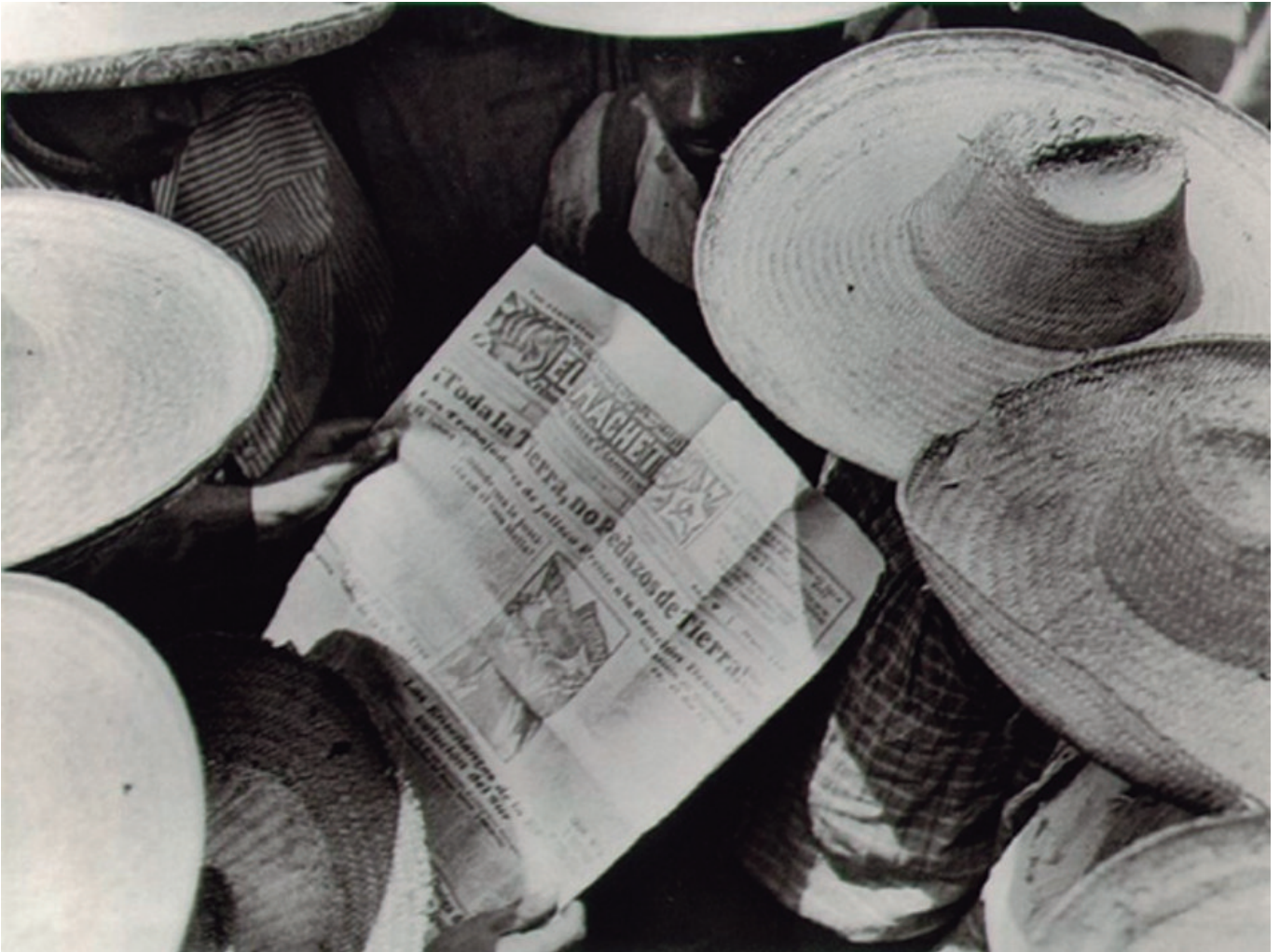
《砍刀报》蒂娜·莫多蒂摄于1926年

《拯救地球计划》依据的是1945年《联合国宪章》的原则，这是全世界最具共识的文件，193个联合国成员国签署了这一约束性条约。希望读者认真阅读该计划以及本期 汇编 文章。写这两份文件是为了引发讨论甚至辩论，也希望它们得到挑战、得到充实。如您有建议或想法，或想表达您利用该计划的心得，请电邮我们： plan@thetricontinental.org