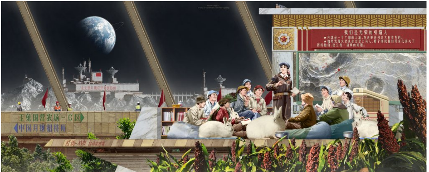
《嫦娥同志》范文南（中国）作于2022年

6584 辆行驶在北京街头。虽然北京的空气要达到自己的标准还有很长的路要走，但空气污染程度已经明显下降。